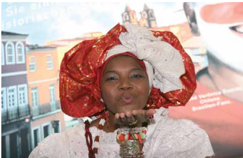
Freundlich werden die Besucher der Internationalen Tourismus-Börse ITB Berlin 2006 am Stand Brasiliens willkommen heißen.

Nach Durchforsten diverser Informationsquellen, dem Besuch der Tourismussmesse HHanseTour vor Ort sowie Onlineumfragen stand unser Konzept: Was sind eigentlich Tourismussessen? Welche gibt es überhaupt? Ist die ITB wirklich die bedeutendste weltweit – und wohin geht der Trend? Die Antworten präsentierten wir unseren